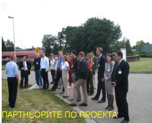
ПАРТНЬОРИТЕ ПО ПРОЕКТА