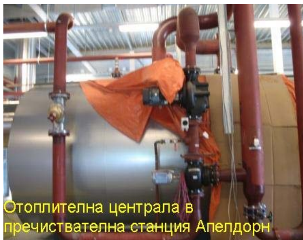
Отоплителна централа в пречиствателна станция Апелдорн