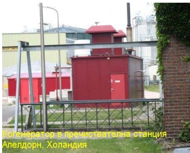
Когенератор в пречиствателна станция Апелдорн, Холандия