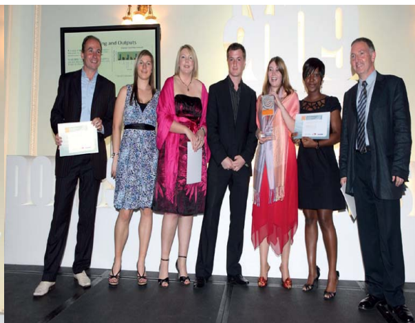
WESTTRANS (Победители), Seltrans и Община Камден (2-ро и 3-то място)