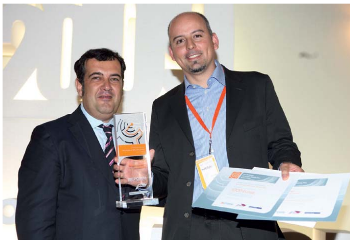
Международно летище Женева