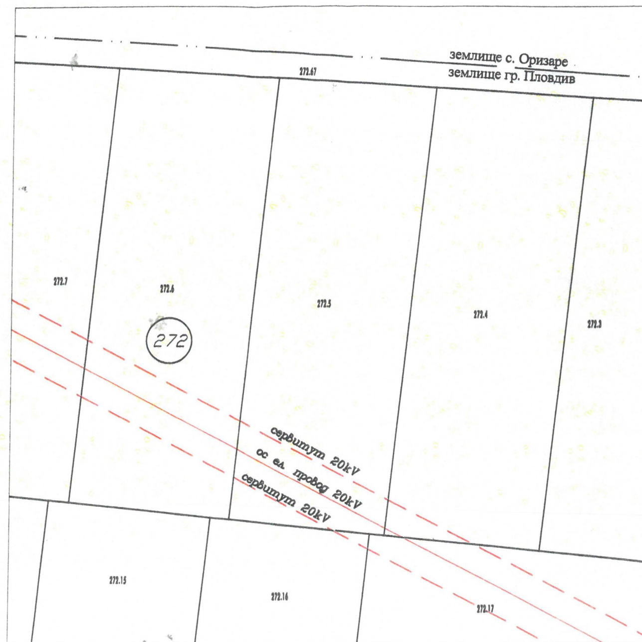
ИЗВЛЕЧЕНИЕ ОТ КК НА ГР. ПЛОВДИВ, ОДОБРЕНА СЪС ЗАПОВЕД №РД-18-48/03.06.09г. НА АГКК/ДВ БР.51/07.07.09г. ЗА ПИ С ИДЕНТИФИКАТОР 56784.272.5 ПО КК НА ГР. ПЛОВДИВ, РАЙОН ЗАПАДЕН, М. ПРОСЛАВ-ЗАПАД, М 1:1000